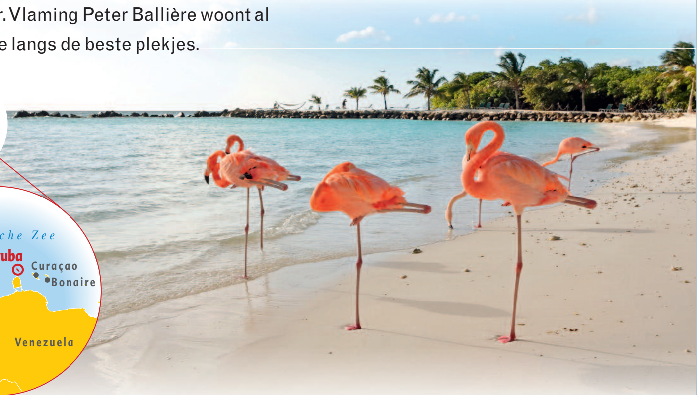
Flamingo's lopen vrij rond op het strand van Renaissance Island.

Sunjets organiseert zes all-in shortski reizen met vertrek op vrijdagavond en terugkeer op dinsdagochtend waardoor je slechts één of maximaal twee werkdagen 'verliest'. Er zijn afreizen op 13, 20 en 27 januari, op 3 februari en op 16 en 23 maart. Er wordt gereisd met een slaapbus en je verblijft twee nachten in vol- of halfpension. Ook de skipas is inbegrepen. Bestemmingen zijn onder meer Tignes, La Plagne en Brides-Les-Bains. Er zijn opstapplaatsen in Oostende, Brugge, Gent en Brussel. Vanaf 409 euro per persoon. Meer info: www.sunjets.be