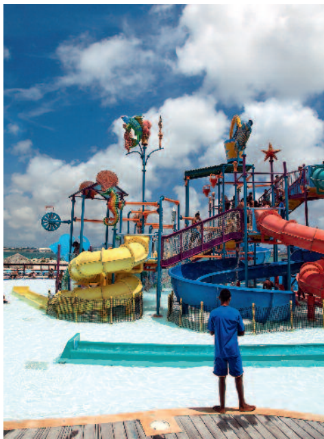
Kids kunnen zich uitleven in de waterspeeltuin op De Palm Island.

locals - hebben hier blijkbaar allemaal wat achtergelaten, van mooi tot knettergek. Die hebbedingetjes vertellen een rijke geschiede-